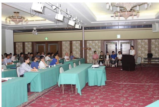
ポスター賞受賞者による講演