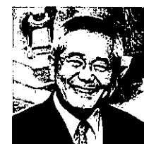
Purdue University Distinguished Professor Mr. Ei-ichi Negishi (Teijin Group Distinguished Fellow 5th year Teijin Kumura scholarship (1957))

When you find your own "Dream", please challenge it thoroughly until the truth is investigated. I look forward to your great success in the future.