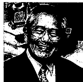
米パデュー大学 根岸 英一特別教授 (帝人グループ名誉フェロー) 帝人久村奨学生第5回生(1957年)

そして自らの「夢」を見つけたら真理を突き詰めるまで、とことんチャレンジしてください。今後の皆さんの大いなる活躍に期待しています。