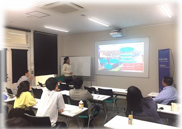
Mansillaさんによる共同研究プロジェクトセミナー