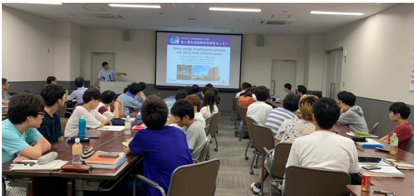
写真左上) 講師先生方 右上) 食事後 下) セミナーの様子