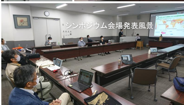
シンポジウム会場発表風景