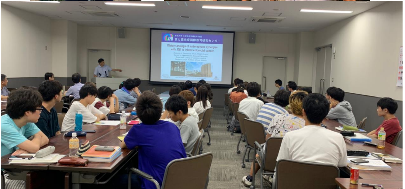
写真左上) 講師先生方 右上) 食事会后 下) セミナーの様子